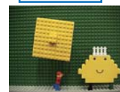
♪LEGOによるアニメーション