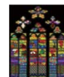
♪グラフィックデザイン